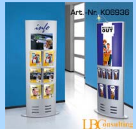
Art.Nr. K06936 – large

Höhe: 165 cm, Breite: 60 cm, Tiefe: 32 cm, Material: Stahl, Farbe: alusilber