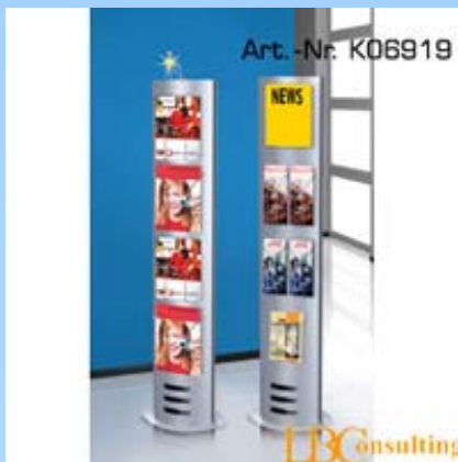
Art.Nr. K06919 – small

Plakattaschen aus Kunststoff in Kristallglas-Optik haften mittels Magnetleisten. Schriftstücke und Plakate lassen sich in Sekundenschnelle wechseln. Eine Leuchte kann ebenfalls angebracht werden.