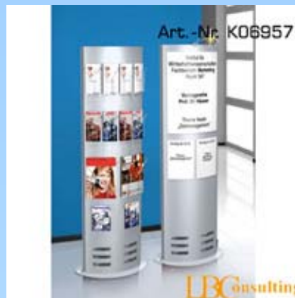
Art.Nr. K06957 – medium

Höhe: 165 cm, Breite: 40 cm, Tiefe: 25 cm, Material: Stahl, Farbe: alusilber